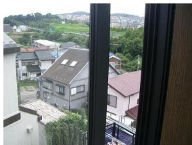
施工前(単板ガラス)