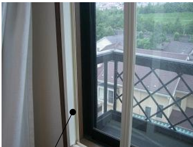
内側の白い枠が、新しく取り付けられた窓です

単板ガラスからアタッチペア(ペアガラス)へ変えて頂いて、エアコンの効きも良くなりました。また、今回、プラマードも付けてみたのですが、エアコンの効きが良くなった事はもちろんですが、近くを電車が走っているのも、その騒音が大幅にカットされ、とても静かで快適な毎日が過ごせています。窓を開ける手間は増えたのですが、その手間を上回る窓の効果が得られたので、とても満足しています。