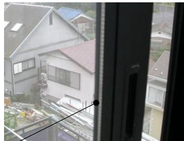
単板ガラスから ペアガラスへ変わっています

※アタッチペアとはサッシ枠を変える事なく、単板ガラスからペアガラスへ変える事が出来るガラスです