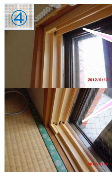
四方キレイにレールが取付られました