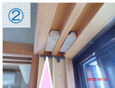
溝にパッキンを詰めて段差を調整します