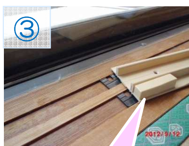
溝の上に、二重窓用のレールを取り付けます