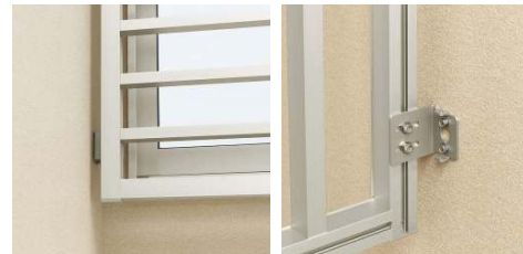
入隅ブラケットの取付け