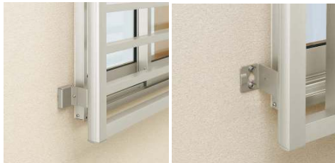
壁付ブラケットの取付け

躯体側ブラケット取付部にはねじ頭が見えない様に、ブラケットカバーを標準設定。ブラケットカバーを止めるのは取外しを防ぐ為、ワンウェイねじを採用。(一般工具(+ノードライバー)での取外しはできません。)また、壁付ブラケットカバーはブラケット本体に引っ掛ける方法で、こじ開けに対しても防ぎます。