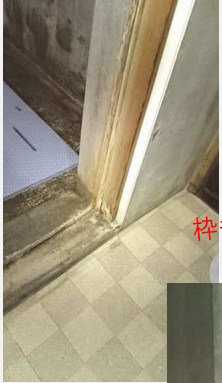
枠も水でボロボロ